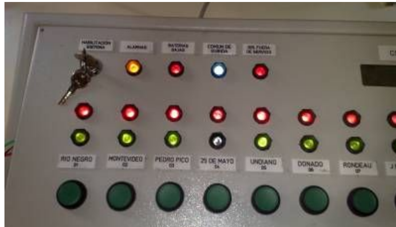
Figura 3.4.1: Imagen de la consola